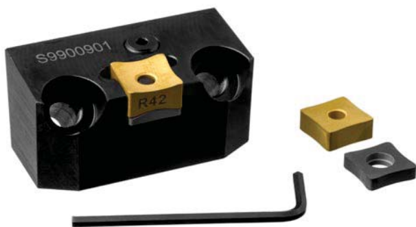
Cartucce - Cartridge

TOOL HOLDER SIDED INSERTS - FIXING SYSTEMS