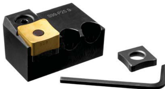
Cartucce - Cartridge