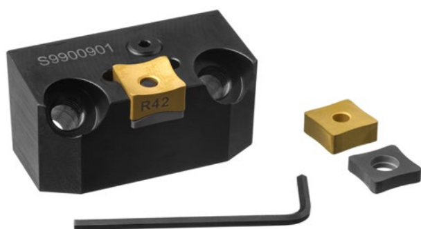
Cartucce - Cartridge

TOOL HOLDER SIDED INSERTS - FIXING SYSTEMS