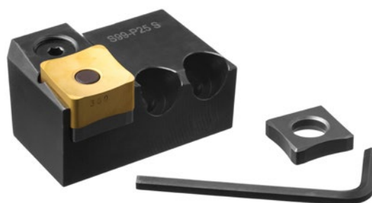
Cartucce - Cartridge